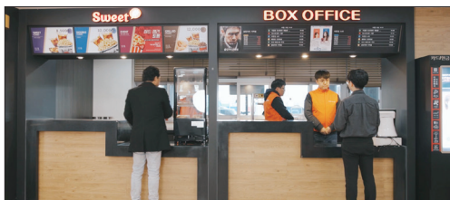
시네마 서비스 직업체험관

대표직무 사무행정 지원, 유통서비스, 병원보조, 조립, 시네마 서비스, 의류분리, 바리스타, 주방보조, 외식서비스, 육아보조 등